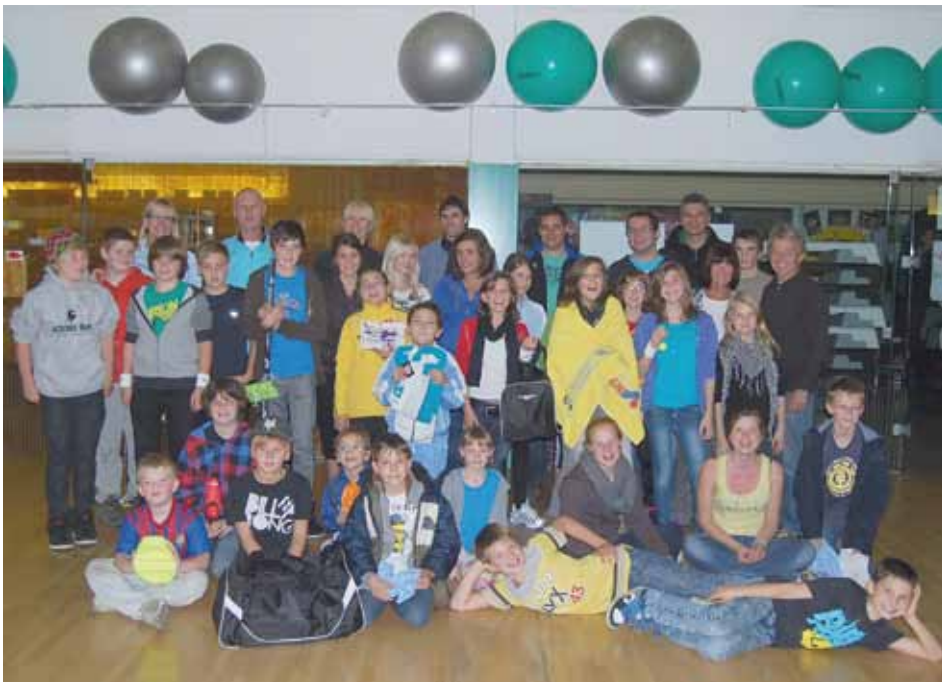
Veranstalter und Vereinsverantwortliche im Kreise der Aktiven.

Zumba an. Tägliche Stunden zur freien Wahl. Nähere Infos unter www.deltasportpark.at