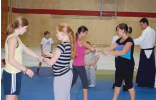
Aikido - die sanfte Form der Selbstverteidigung - begeisterte die Jugendlichen.

Kinder und Jugendliche der Stadt Vöcklabruck hatten am Samstag, den 22. Oktober 2011 die Möglichkeit,