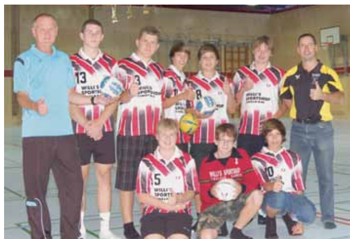
Die Handballer bespielten den neuen Hallenboden als Erste und waren begeistert.

Seit kurzem ist die sanierte Bezirkssporthalle Vöcklabruck wieder in Betrieb. Mit Mitteln des Bundes, des Landes OÖ und der Stadt wurden der Hallenboden, die Markierungen und die Prallwände auf den neuesten Stand der Sporttechnik gebracht. Verbessert worden sind weiters die Gerätschaften, die Tore und der Freiplatz hinter der Halle. Die Gesamtkosten der Sanierung betragen € 1,5 Mio. inkl. Außenanlagen, der Beitrag der Stadt liegt bei € 206.000.