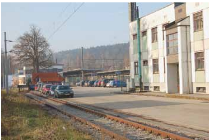
Eine bauliche Trennung zwischen Parkplatz und Ladebereich der ÖBB wird in Kürze erfolgen.

Um den Vorschriften des Verkehrsarbeitsinspektorates zeitgerecht zu entsprechen, ist eine rasche Vorgehensweise erforderlich, wobei als Fertigstellungsfrist der 16. Dezember 2011 behördlich festgelegt wurde.