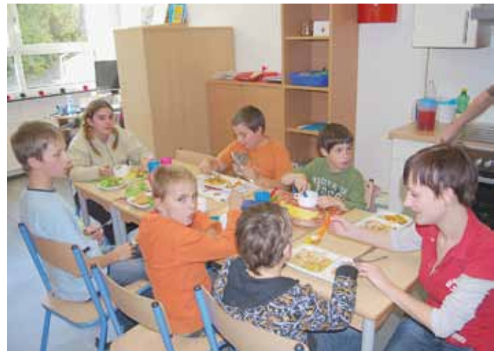
Der Heilpädagogische Hort in den neugestalteten Räumlichkeiten.

Träger dieser neuen Einrichtung ist die Lebenshilfe OÖ. Auf der Grundlage des OÖ. Kinderbetreuungsgesetzes wird sie vom Land OÖ. finanziert.