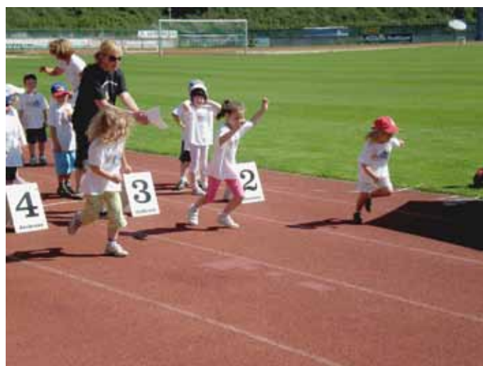
Die Laufbahn wird auch von den kleinsten Athleten mit großer Begeisterung benützt.

Die beschädigten Belagsstellen wurden durch die Strabag notdürftig ausgebessert und eine neue Linierung durchgeführt. In den Wintermonaten ist derzeit kein Betrieb auf der Laufbahn möglich.