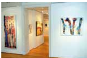
Sehenswerte Stadtgalerie im Lebzelterhaus