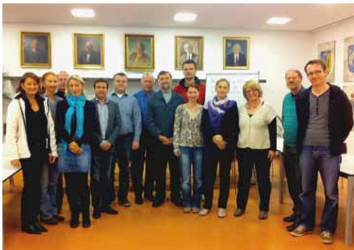
Die Vertreterinnen und Vertreter des Integrations-Arbeitskreises

Es soll zu einem regelmäßigen Austausch zwischen den Vertretern der Migrantenvereine, Vertretern der unterschiedlichen Bevölkerungsgruppen, die nicht vereinsmäßig organisiert sind, und den verantwortlichen Vertretern der Stadt Vöcklabruck kommen.