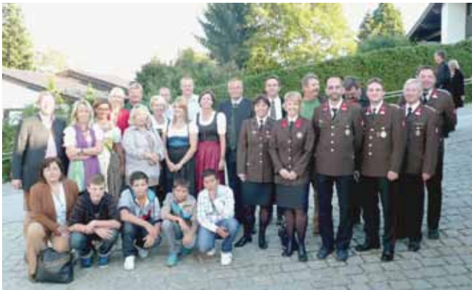
Die Vöcklabrucker Delegation beim Städtepartnertreffen in Hauzenberg.

Im Mittelpunkt stand heuer eine gemeinsame historische Handwerksausstellung, bei der die Vöcklabrucker das Bäckerhandwerk und einige Zunftzeichen aus dem Heimathaus vorstellen konnten.