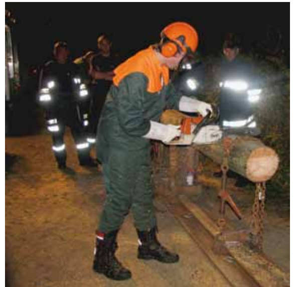
Die Feuerwehrmannschaften nutzen das neue Trainingsgelände für Übungszwecke und Wettkampfvorbereitung.

Es können verschiedenste Einsatzszenarien geübt werden. Der angrenzende Mühlbach stellt eine perfekte Ergänzung zum Übungsgelände dar. Sowohl die Jugendgruppe als auch die Bewerbungsgruppe werden künftig das