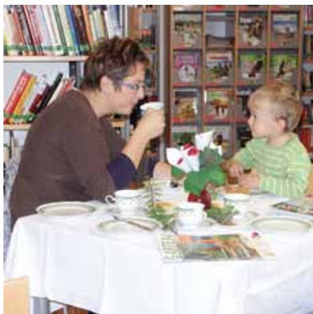
Das Lesefrühstück war ein Genuss für Groß und Klein.

Gemeinde- und Pfarrbibliotheken, Schulbibliotheken, Stadt- und Landesbibliotheken, Universitätsbibliotheken, sogar die Österreichische Nationalbibliothek beteiligten sich an dieser Aktion und rückten damit als Orte der Begegnung ins Bewusstsein der Öffentlichkeit.