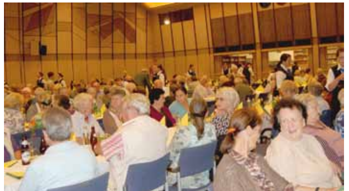
Gute Unterhaltung beim Seniorentag im Vöcklabrucker Stadtsaal

Drei Blechbläser der Landesmusikschule unter der Leitung von Johannes Hartl und ein Ensemble der Stadtmusik sorgten für die musikalische Unterhaltung.