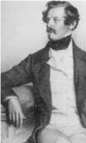
Alexander Freiherr von Bach (1813-1893).

Tschechischer Historiker und Politiker, hatte den Vorsitz am Slawenkongress 1848 in Prag.