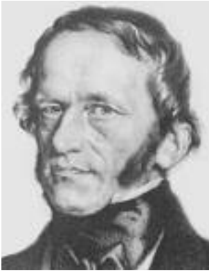
Franz Palacký (1798-1876).

Tschechischer Historiker und Politiker, hatte den Vorsitz am Slawenkongress 1848 in Prag.