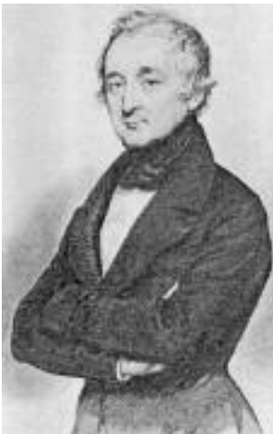
Karl Kübeck, Baron von Kübau (1780-1855).

Österreichische Nationalbibliothek Wien.