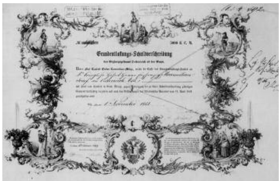
Beispiel einer Grundentlastungs-Schuldverschreibung vom 1. November 1851.

Zur Durchführung der komplizierten Werterhebung und Entschädigungsberechnung wurden in allen Kronländern ministerielle Kommissionen eingerichtet, die ihre Tätigkeit in Oberösterreich bis zum Jahre 1854 zum Abschluss brachten. Für die Abwicklung des Zahlungsverkehrs wurde in jedem Kronland ein Grundentlastungsfonds eingerichtet, aus dem die Berechtigten die ihnen zustehenden Entschädigungssummen in auf der Börse handelbaren und zu 5 % verzinslichen Grundentlastungsobligationen erhielten. Ob sich die Grundentlastung mehr zugunsten der Bauern auswirkte oder im Gegenteil zu einer Sanierung des unproduktiv gewordenen verschuldeten adeligen Besitzes führte, ist in der Forschung noch immer umstritten. Als Tatsache kann aber gelten, dass die Durchführung der bäuerlichen Grundentlastung und die Entschädigung ein wichtiger Beitrag zur Sicherung des sozialen und politischen Friedens war. 68