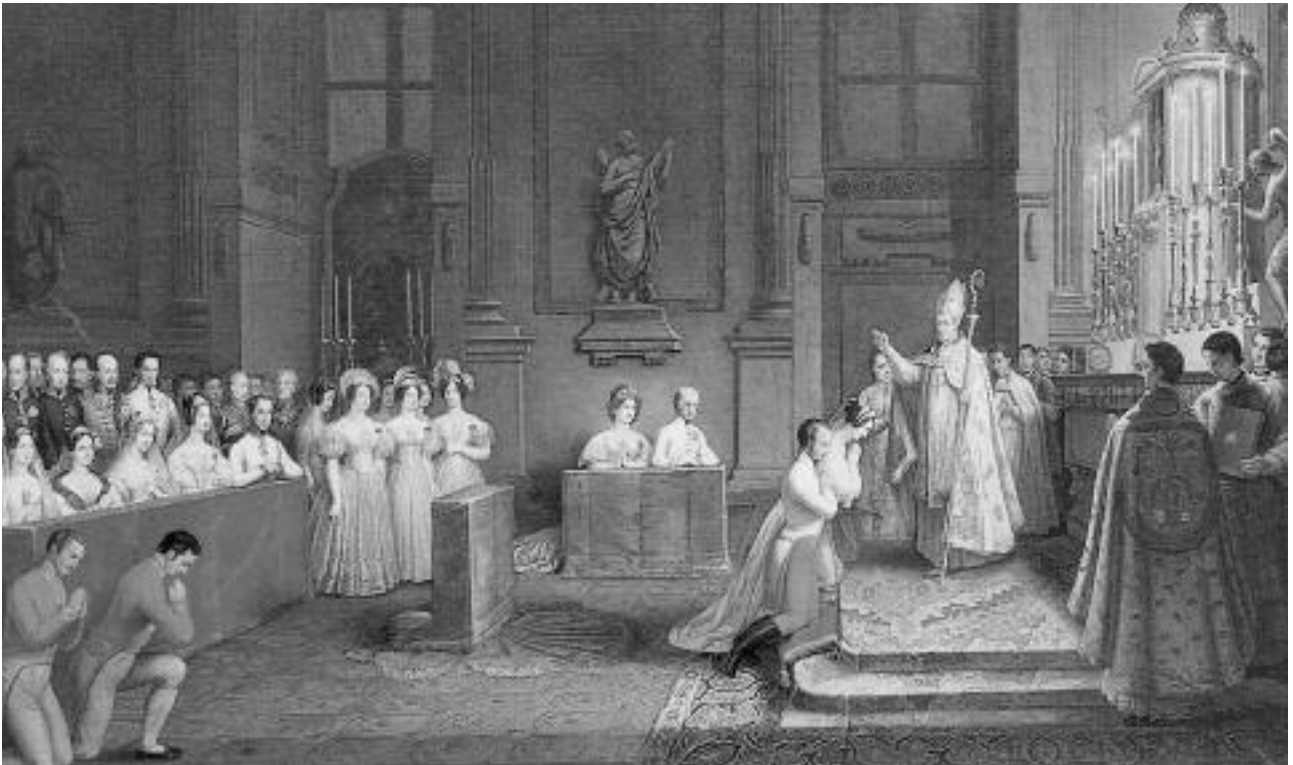
Die Trauung des Thronfolgers Ferdinand mit Maria Anna Carolina Pia am 27. Februar 1831 in der Hofburg.