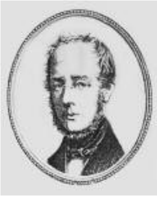
Franz Stadion Graf von Warthausen (1806-1853).

neuen absolutistischen Grundsätze ist Karl Baron Kübeck von Küban (1780-1855) anzusehen, der schon gemeinsam mit Franz Graf Stadion von Warthausen (1806-1853) an der Erstellung der oktroyierten Märzverfassung mitgewirkt hatte. Pressefreiheit, öffentliche Gerichtsverfahren, Gemeindeverfassung und damit jede Form von Konstitutionalismus waren abgeschafft. Der Reichsrat blieb nur noch als dem Monarchen unterstellter Kronrat in Funktion. 26