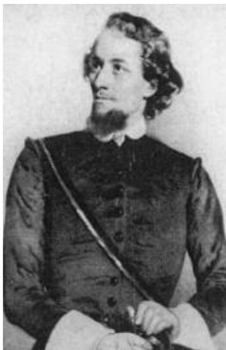
Hans Kudlich (1823-1917).

Nach den Ereignissen in Wien, die am 6. Oktober zur Ermordung des Kriegsministers Graf Latour geführt hatten, unternahm Hans Kudlich vom 14. bis 25. Oktober in Oberösterreich eine Landsturmwerbung zur Unterstützung der Revolutionäre in Wien. Die Werbefahrt ging über Linz, Wels, Laakirchen, Gmunden, Vöcklabruck, Ried, Grieskirchen, Wallern, Eferding, Scharn wieder nach Wels und dann über Kremsmünster, Steyr, Amstetten nach Wien zurück.