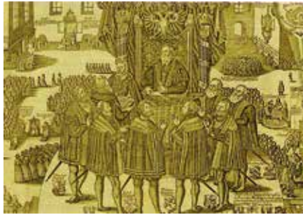
„Übergebung der Augspurgischen Confession“ an Kaiser Karl V. (1530)

Als verhängnisvoll für die katholische Kirche erwies sich, dass beim Ausbruch der Reformation dem Bistum Passau kein Bischof vorstand, sondern es in der Person des erst 17-jährigen Herzogs Ernst von Bayern nur einen Administrator gab, der aufgrund einer päpstlichen Dispens nie die geistlichen Weihen empfing. Er verkannte zunächst die Gefahr, die im Land ob der Enns von der neuen Lehre für die alte Kirche ausging, doch scheiterten seine später eingeleiteten Maßnahmen gegen das Vordringen des Luthertums auch an der geringen Unterstützung, die er im Land selbst fand. Vor allem der erbitterte Widerstand der schon früh evangelisch gewordenen weltlichen Landstände, aber auch das Misstrauen der Landesfürsten gegen einen Wittelsbacher am Passauer Bischofsthron trug wesentlich zum Fortschreiten des Protestantismus im Land bei. Eine weitere Begünstigung der evangelischen Lehre im Land ergab sich aus dem Umstand, dass seit Beginn der Reformation das Amt des Landeshauptmanns in evangelischer Hand war. Mangels einer eigenen Regierung im Land war er das einzige ausführende Organ der landesfürstlichen Anordnungen. Als Angehöriger des einheimischen Adels fühlte er sich mehr den landständischen protestantischen Interessen verbunden,