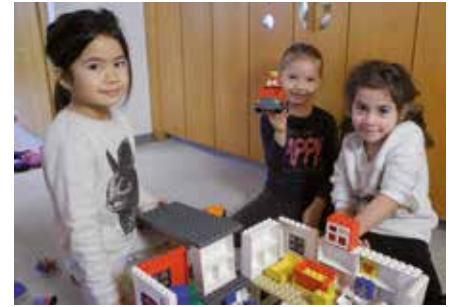
Bis 28. Februar kann man sein Kind für einen Kindergartenplatz anmelden

Wer sein Kind im Kindergartenjahr 2017/2018 in einem der Kindergärten der Stadtgemeinde Vöcklabruck gut aufgehoben wissen möchte, der sollte es zeitgerecht anmelden. Die Frist dafür endet am Dienstag, 28. Februar 2017.