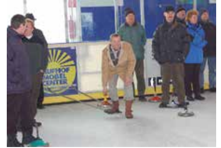
Bei den Eisstock-Stadtmeisterschaften winken wieder attraktive Preise