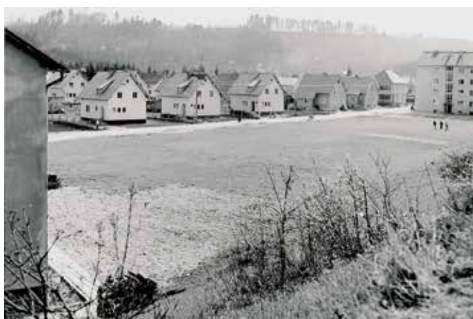
Dürnauer Straße 1957

1956 errichtete die Stadt in der Dürnauer Straße 70 das erste Mehrparteienhaus, 1962 bis ca. 1968 dann den Stelzhamerhof.