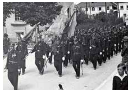
Ein prächtiges Bild: Die Bürgergarde anno 1934

10 Jahre nach seiner „Wiedererstehung“ feiert das „K. u. k. unif. Bürgerkorps der landesfürstlichen Stadt Vöcklabruck“ quasi Geburtstag, und zwar am Sonntag, 7. Mai 2017.