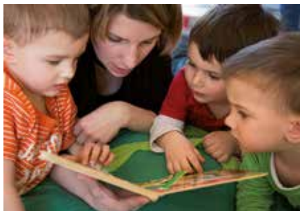
Lesen macht Spaß und eröffnet neue Welten

2017 startet das Literaturfestival „LESERstimmen“ zum fünften Mal: Österreichische Autoren und Illustrierende von zwölf ausgewählten Kinder- und Jugendbüchern begeben sich auf Lesereisen in Österreichs Bibliotheken. Auch die Stadtbücherei ist mit dabei.