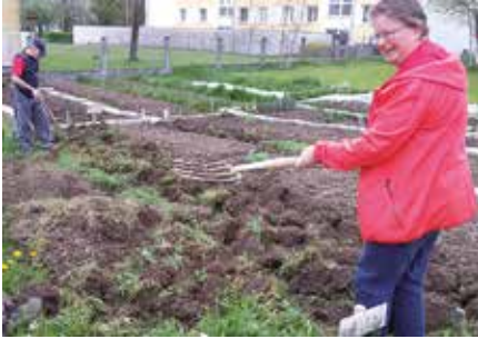
Gemeinsam macht das Garteln noch mehr Spaß

In wenigen Wochen gehts wieder los. Im Nachbarschaftsgarten in der Dürnau werden die vielen Gartenbeete aufbereitet und Gemüse und Sträucher gepflanzt.