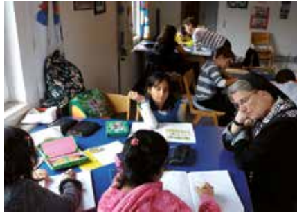
Deutschlehrerinnen und -lehrer sind gefragt

Ehrenamtliche leisten wertvolle Dienste in der Betreuung geflüchteter Menschen. Bei einem Koordinationstreffen mit Hauptamtlichen wurde abgesteckt, wo Freiwillige ihre Fähigkeiten am besten einsetzen können.