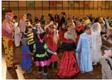
Die Kinder erwartet jede Menge Spaß

Am Rosenmontag, dem 27. Februar, lädt die Stadt Vöcklabruck wieder zum traditionellen Kinderfasching in den Stadt-saal ein – bereits zum 21. Mal.