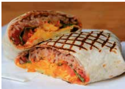
Guten Appetit beim Streetfood Festival!