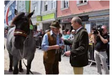
Vöcklabrucks traditionsreicher Pferdemarkt wird neu aufgestellt

Im 113. Jahr seines Bestehens bekommt der traditionelle Vöcklabrucker Pferdemarkt ein neues Gewand.