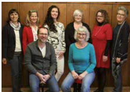
Das Team vom Kinderschutzzentrum Impuls

Computer und Handys sind aus unserer Kommunikation und aus unserem Leben nicht mehr weg zu denken. Eltern und auch Pädagogen stellen sich daher Fragen nach einer angemessenen, verantwortungsvollen Mediennutzung: