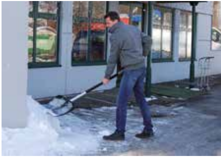
Verantwortungsbewusste Bürger schaufeln ihren Gehsteig frei

Spiegelglatte Gehsteige, zentimeterdicke Eiszapfen, eine Rutschbahn vor der Haustür: Das kann gewaltig ins Auge gehen.