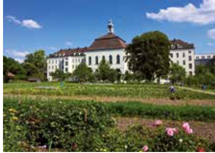
Die Franziskanerinnen laden in ihren idyllischen Garten ein

Die Franziskanerinnen von Vöcklabruck stellen ab März 2017 einen Teil ihres Gartens im Areal des Mutterhauses für „Gärtnerinnen und Gärtner“ (oder solche, die es werden wollen) zur Verfügung.