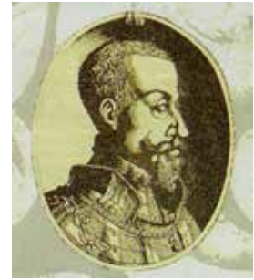
Kaiser Maximilian II. (1564 - 1576)