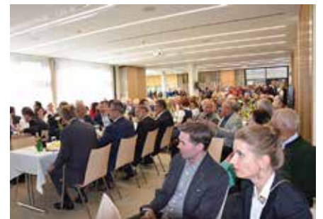
Ein volles Haus bei der festlichen Eröffnung.

Nach den Plänen des Architekturbüros Gärtner + Neururer wurde das neue Haus von der Landeswohnungsgenossenschaft (LAWOG) in zweieinhalbjähriger Bauzeit errichtet.