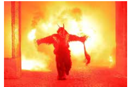
Ein schaurig-schönes Spektakel erwartet die großen und kleinen Besucherinnen und Besucher.

Feuer, Rauch und Glockenläuten – der Perchtenlauf ist mittlerweile auch in Vöcklabruck zur großen Tradition geworden.