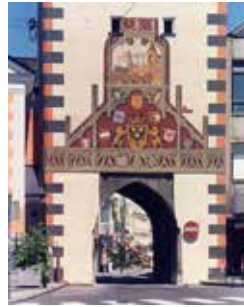
Oberer Stadtturm - Fresken