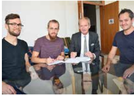
Vertragsunterzeichnung mit dem Bürgermeister.

Nun ist es „amtlich“ – die OTELO-Erfolgsgeschichte geht im Offenen Kulturhaus OKH weiter. Bei der Vertragsunterzeichnung des OTELO als neuer Mieter im Offenen Kulturhaus OKH Vöcklabruck präsentierten die Verantwortlichen des Vereins dem Bürgermeister ihre aktuellen Projekte.