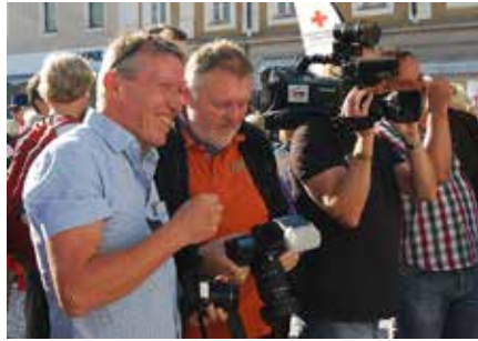
Die Medien verfolgten mit Argusaugen...