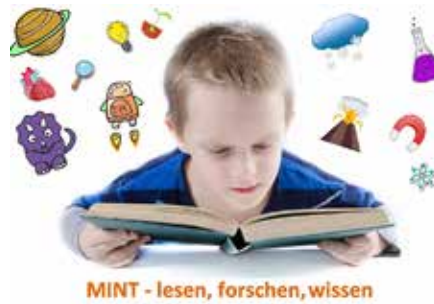
MINT - lesen, forschen, wissen