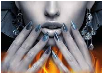
Die Feuernacht ist immer ein ganz besonderes Erlebnis.

Am Donnerstag, 29. November 2018, verlängern die teilnehmenden Geschäfte der Vöcklabrucker Innenstadt ihre Öffnungszeiten und locken mit speziellen Weihnachtsangeboten. Für all jene, die gerne in vorweihnachtlichem Ambiente gemütlich einkaufen möchten, haben die Innenstadtgeschäfte bis 21.00 Uhr geöffnet.