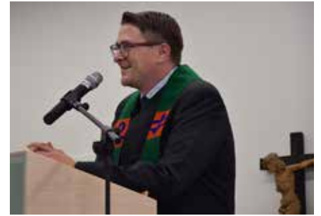
Der Segen „von oben“ durfte nicht fehlen.

Es war ein historisches Ereignis – und eines, auf das viele Jahre lang hingearbeitet worden war: Am 18. Oktober wurde das neue Seniorenheim der Stadt Vöcklabruck feierlich und mit vielen Gästen eröffnet.