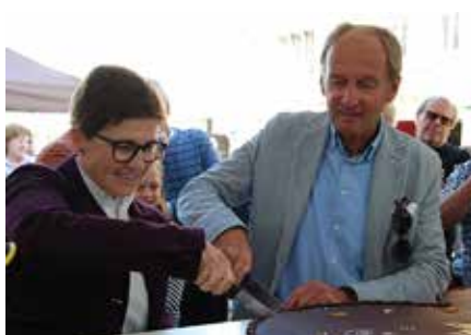
Eine große Herztorte wartete...