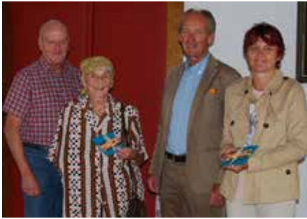
Die glücklichen Gewinnerinnen von je einer Stadtbus-Jahreskarte.

Im letzten Rathauskurier hatte die Stadtverwaltung zwei Bürger oder Bürgerinnen gesucht, die je eine Jahreskarte für den Stadtbus gewinnen wollten und dies am originellsten begründen konnten. Nun stehen die glücklichen Gewinnerinnen fest.