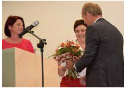
Blumen für treue Mitarbeiterinnen.