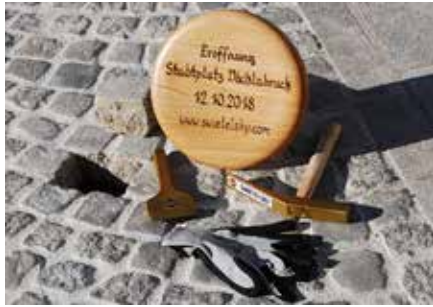
Den letzten Pflasterstein setzte der Bürgermeister.