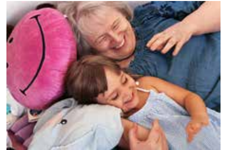
Kinder genießen jede Minute mit der Leihoma – und umgekehrt.

Welches Kind wünscht sich nicht eine Oma zum Spielen, Lachen, Spaß- und Liebhaben? Der Katholische Familienverband OÖ. bietet seit 21 Jahren Unterstützung für junge Familien - und für Frauen ab 40 Jahren die Möglichkeit, Kinder als „Leihomas“ ein Stück ihres Lebensweges zu begleiten.