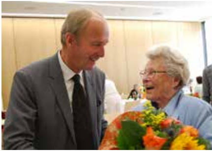
Regelmäßig feiern die Stadtvertreter...