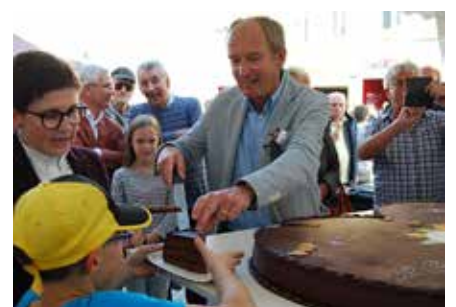
... auf die Leckermäulchen.