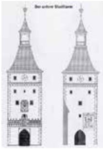
Unterer Stadtturm - Außen- und Innensicht