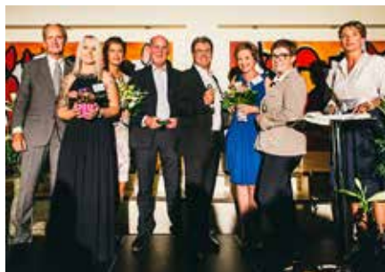
Die Anwaltskanzlei Landl & Edelmann feierte ihr 25-jähriges Bestehen.