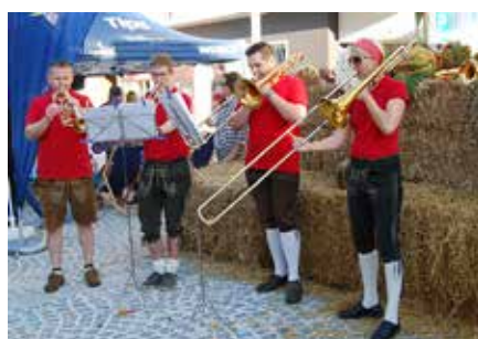
Es war ein Fest für die ganze Stadt.

Beim großen Eröffnungsfest war halb Vöcklabruck auf den Beinen, um sich ein Bild vom neuen Stadtplatz zu machen. Besondere Attraktion war eine überdimensionale Torte in Herzform, die an die Besucherinnen und Besucher verteilt wurde.