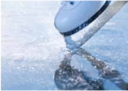
Wer Eissport liebt, ist in der REVA-Halle genau richtig.

Seit Anfang November hat die REVA-Halle ihre Pforten wieder für die Fans des glatten Eises geöffnet – ob Schlittschuhläufer, Eishockeysportler oder Eisstockschießen. Bis Mitte März bietet die Eishalle wieder täglich ab 14.00 Uhr perfekte Bedingungen – sowohl für Anfänger als auch für Köhner.