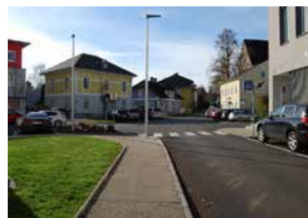
Alles neu machte der Sommer 2018 auch in dieser Hinsicht: Die Feldgasse wurde gänzlich umgestaltet.

Es war eine der Großbaustellen des Jahres 2018: In einer fünfwöchigen Bauzeit wurde die Feldgasse zwischen dem Busbahnhof Ferdinand-Öttlstraße und der evangelischen Friedenskirche general saniert.