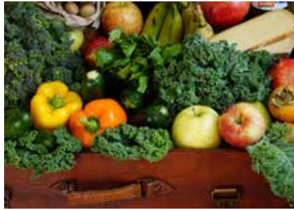
Auf dem Markt kann man stressfrei einkaufen und heimische Produzenten unterstützen.

Das ganze Jahr über bieten die beiden Märkte, der traditionelle Wochenmarkt am Mittwoch und der Frischemarkt am Samstagvormittag, die Möglichkeit, mitten in der Stadt regionale, saisonale und auch bio produzierte Lebensmittel zu kaufen: Jeden Mittwoch von 7.00 bis 12.30 Uhr und samstags von 7.00 bis 12.30 Uhr. Angeboten werden Obst, Gemüse, Fleisch, Fisch, Milchprodukte, Backwaren und mehr.