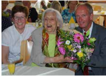
... mit den Seniorinnen und Senioren.