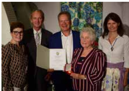
Ein Traditionsunternehmen seit 125 Jahren: Dekor Berger am Graben.