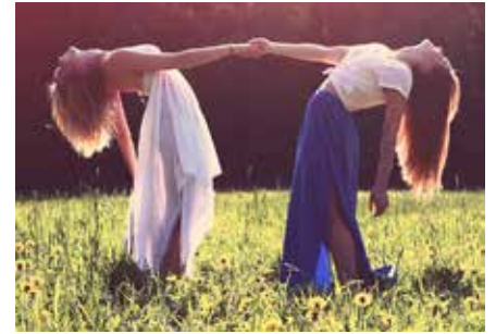
Eigene Kraftquellen zu finden ist immens wichtig.

Zu einem Genussfrühstück mit einem spannenden Vortrag laden die Gesunde Gemeinde und das Familienbundzentrum Regau/Vöcklabruck ein.