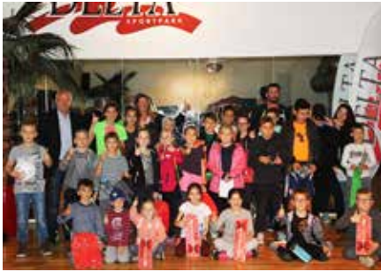
Sport macht Spaß, fanden diese Kinder.

Wie schon Tradition, hatten Vöcklabrucker Kinder und Jugendliche auch heuer wieder die Möglichkeit, unterschiedlichste Sportarten unter fachkundiger Anleitung auszuprobieren – und das völlig kostenlos. Die Gesunde Gemeinde Vöcklabruck und die heimischen Sportvereine hatten eingeladen, so Unterschiedliches wie Klettern, Schwimmen, Basketball, Hand- und Fußball, Turnen und erstmals auch Eishockey, Aikido, Fechten oder Leichtathletik zu testen. Das Einkaufszentrum Varena sorgte mit gesunden Snacks für das leibliche Wohle der jungen Sportler. Im Anschluss wurden noch tolle Preise unter allen Teilnehmern verlost.